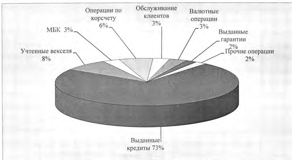
Рисунок 1 - Структура доходов ООО «XXX» в 2009 г.